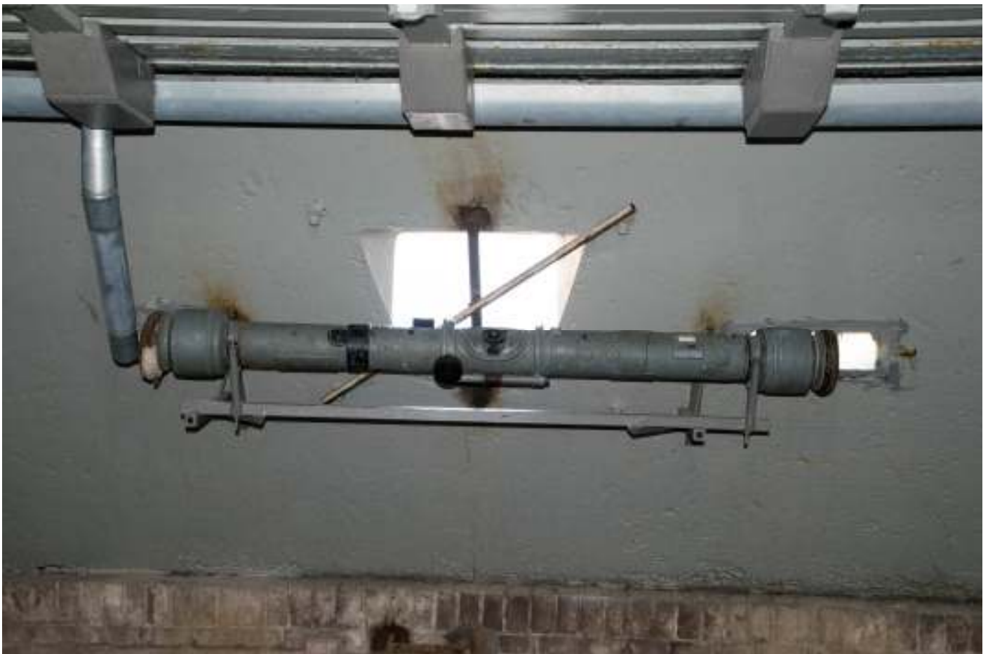
Foto 2 zoals de opstelling is in het Fort

Dit kanon 15 cm lang 25, zoals gebruikt in de hoofdbatterij, bestaat nog en is te zien in met Nationaal Militair Museum Soesterberg (eerder gestaan bij Fort Hoek van Holland.) Dit kanon