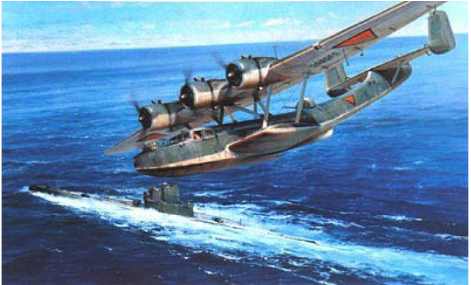
K type onderzeeboot met een Donier DO24